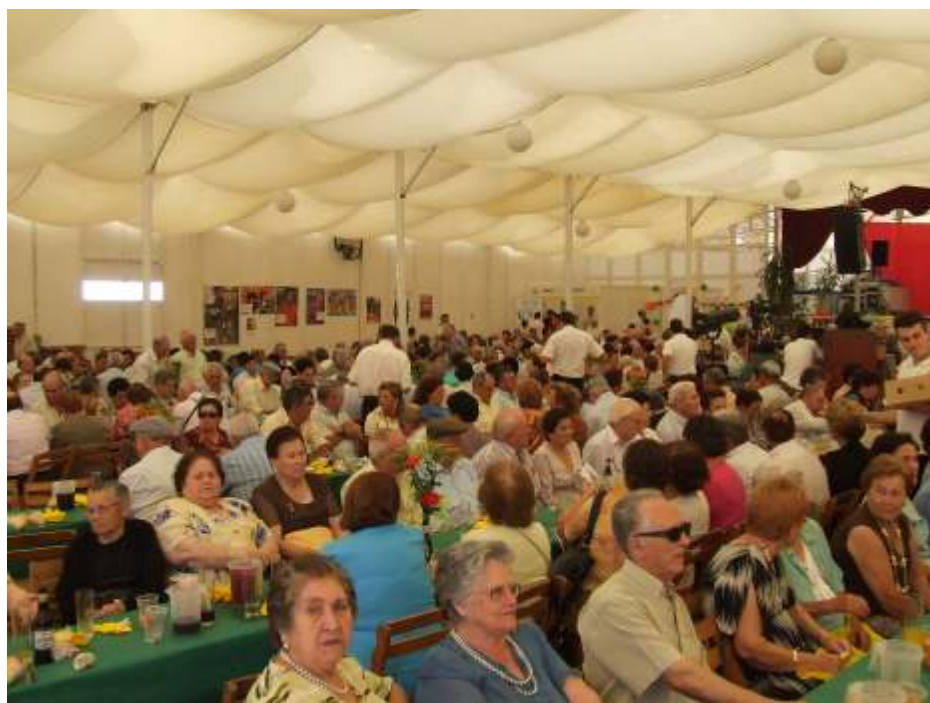
Los mayores disfrutaron de la comida y de las actuaciones

Pulimpress Pulidos, limpiezas e impresos