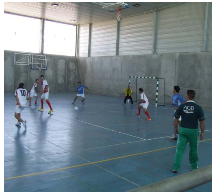
La Asociación Deportiva de Fútbol Sala "Las Vegas" no puede disputar sus partidos en el pabellón

Desde El Cuervo Información dar ánimos al equipo y quedar a su disposición para lo que necesiten.