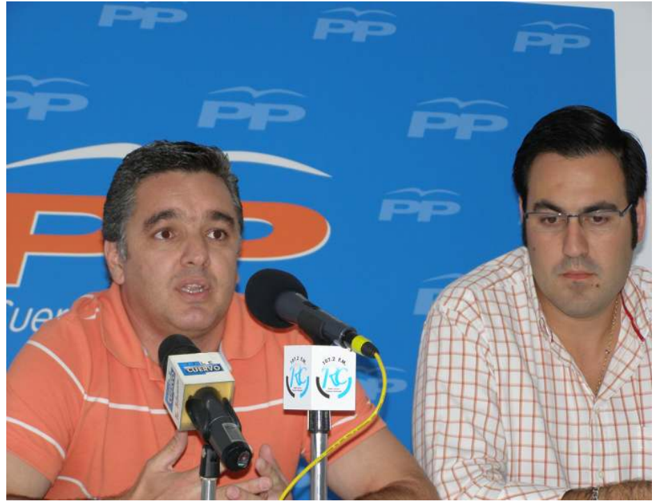
Momento de la rueda de prensa de Partido Popular de El Cuervo