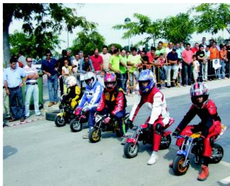
En la línea de salida, preparados para la competición