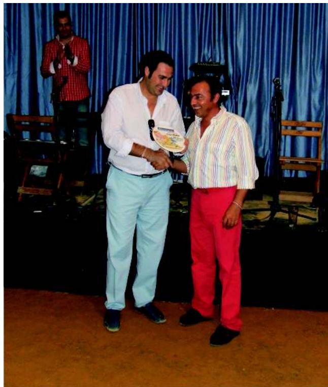
"Los Amigos", caseta más antigua de la feria, tercer premio