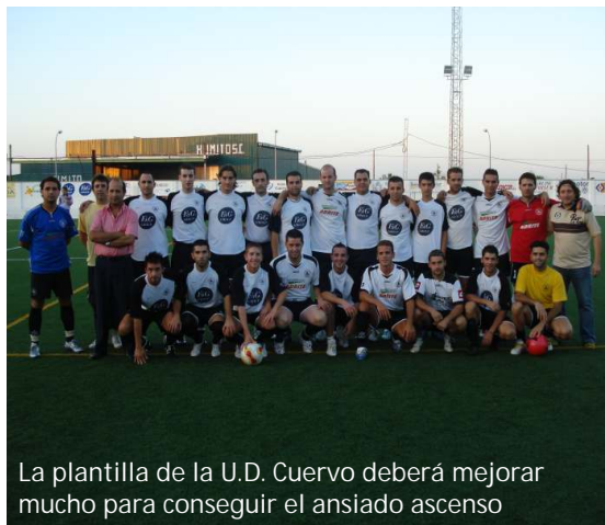
La plantilla de la U.D. Cuervo deberá mejorar mucho para conseguir el ansiado ascenso

Aún tiene tiempo para reaccionar y con las nuevas incorporaciones que se han realizado esperamos que la U.D. Cuervo vuelva por la senda del triunfo que tantas alegrías nos dio la temporada pasada a pesar de no conseguir el ansiado objetivo que no debe ser otro que el ascenso a Preferente.