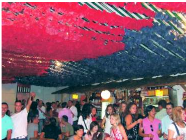
El gran ambiente de la caseta ganadora

No hubo tanta unanimidad en los otros dos premios ya que fueron muchas las casetas que optaban a ese premio, según los vecin@s preguntados, pero finalmente recayó en la caseta