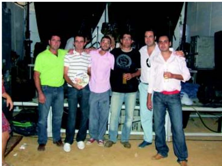
La directiva de "ni pa ti, ni pa mi, posa orgullosa con su primer premio

que le da la fuerza para seguir adelante, además de contar con nuevos socios, desde estas líneas felicitar a los socios de la caseta "Los 25" por su cumpleaños y desearles todo lo mejor para los próximos años, y a las demás casetas decirles que el año que viene volveremos a entregar estos premios por lo que les pedimos "que se pongan las pilas".