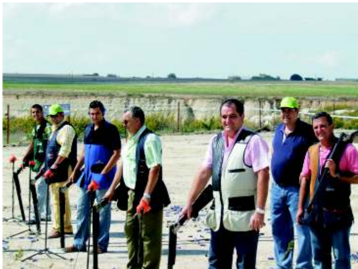
Los tiradores participantes se preparan para su turno