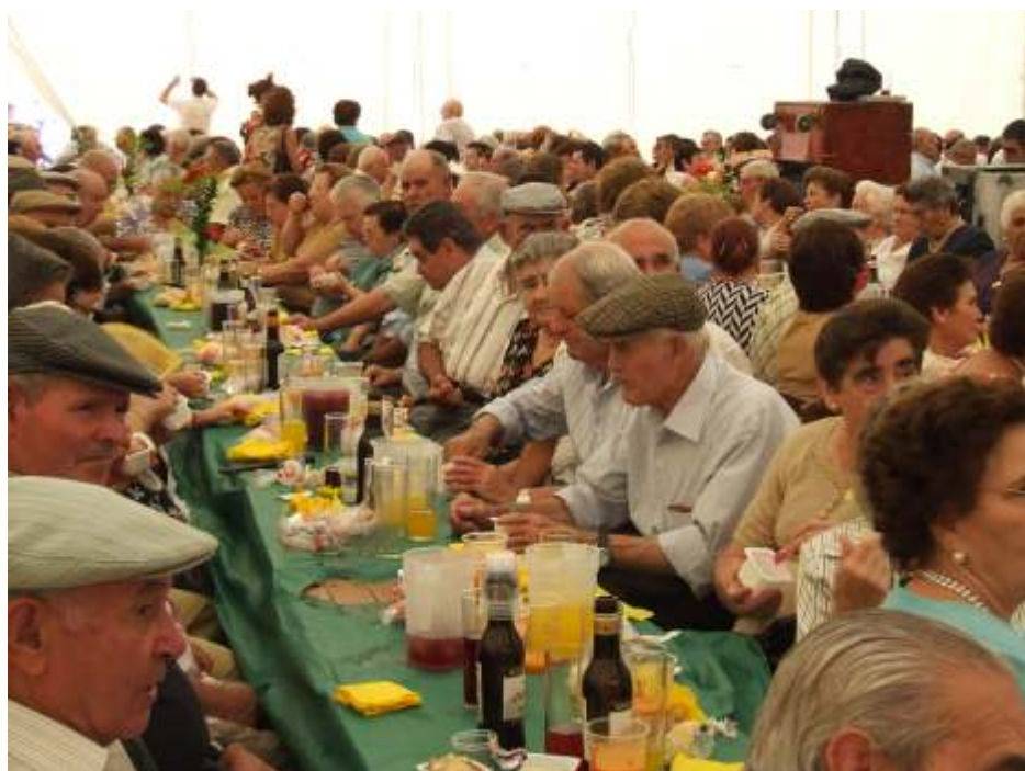
La "polémica del vino" no agrió la fiesta de la comida de nuestros mayores