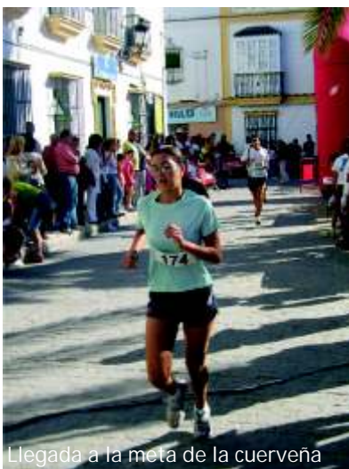
Llegada a la meta de la cuerveña