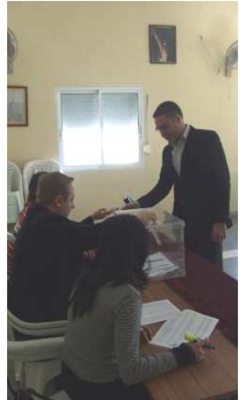
El nuevo Hermano Mayor votando