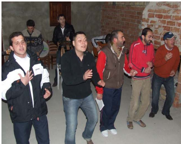
Muchos meses de ensayos para que salga todo perfecto

Por todo ello desde estas líneas queremos dirigirnos a todos los amantes del carnaval para que disfrutemos de todas y cada una de las agrupaciones y para que animemos por igual a todas y cada una de las agrupaciones ya que las horas de trabajo son las mismas para aquellas que son favoritas como para las que no lo son y merecen el mismo respeto, el mismo respeto que se muestran las agrupaciones unas por las otras y que no debe llevarnos a espectáculos tan lamentables como los que sucedieron hace unos años, disfrutes del carnaval, de una de las mejores fiestas que tenemos y que entre todos tenemos que hacer aún más grande.