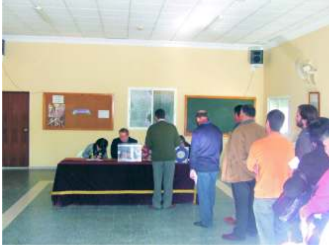
Se formaron colas para votar durante la mañana

Desde estas líneas queremos una vez más mostrar nuestro total apoyo a esta nueva Junta de Gobierno y desearles lo mejor en esta nueva etapa que comienza.