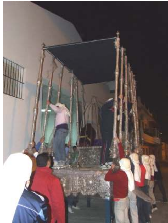
Hay que hacer muchas pruebas durante los ensayos