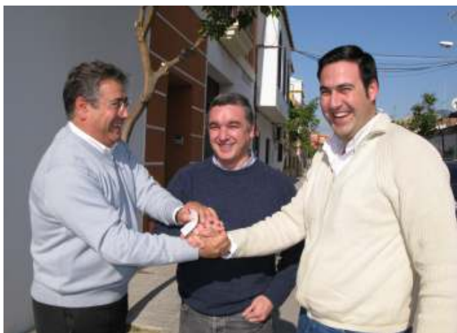
Zoido con el concejal y el presidente del PP de El Cuervo

José Ignacio Zoido, candidato del Partido Popular al Parlamento andaluz visitó nuestro pueblo y dio una rueda de prensa en la que tocó temas importantes para nuestro pueblo, como la liberalización de la autopista, la construcción de la autovía Cádiz-Huelva y la futura autovía de circunvalación, así como la recuperación de la Laguna, puntos que llevará en el programa electoral el Partido Popular para las elecciones del próximo 9 de Marzo, así mismo mostró su disconformidad con la nueva ubicación del Hospital comarcal por una cabezonada de Mari Fernández.