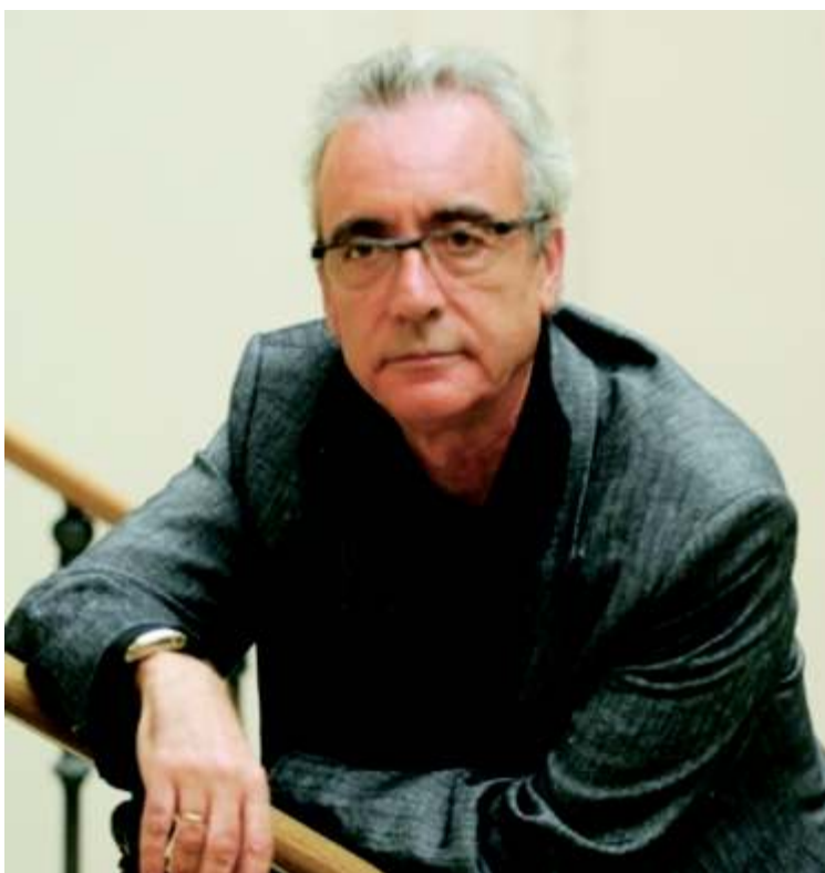
Juan José Millás

Ambos suponen un gran reclamo para el público.