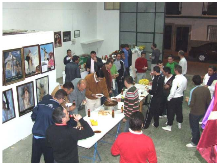
Los costaleros compartieron un buen rato juntos.

La primera tuvo lugar el pasado Viernes 8 de Febrero y tuvo como protagonista la carrillada y las tapas que regadas con una buena cerveza se tomaron los costaleros mientras conversaban de sus experiencias debajo de las trabajaderas y mostraban sus ideas para que la Hermandad fuera mejor día a día.