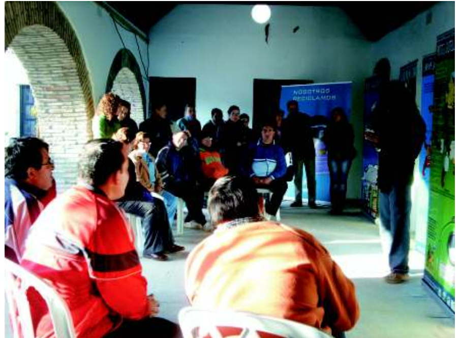
Uno de los profesores da una explicación a alumnos del Centro Germán Gómez Medina

Estas jornadas deben ser un buen comienzo para continuar con otras actividades indicadas para que nuestro medio ambiente cobre de mejor salud, junto a las Jornadas por la recuperación de la laguna hemos tenido un mes completo y lleno de actividades dirigidas a la recuperación de nuestro medio ambiente tan dejado de la mano de Dios en los últimos tiempos, y a nuestros gobernantes tenemos que decirles que la concienciación es un buen paso pero que debemos poner los medios para que los ciudadanos cumplan con su obligación de reciclar.