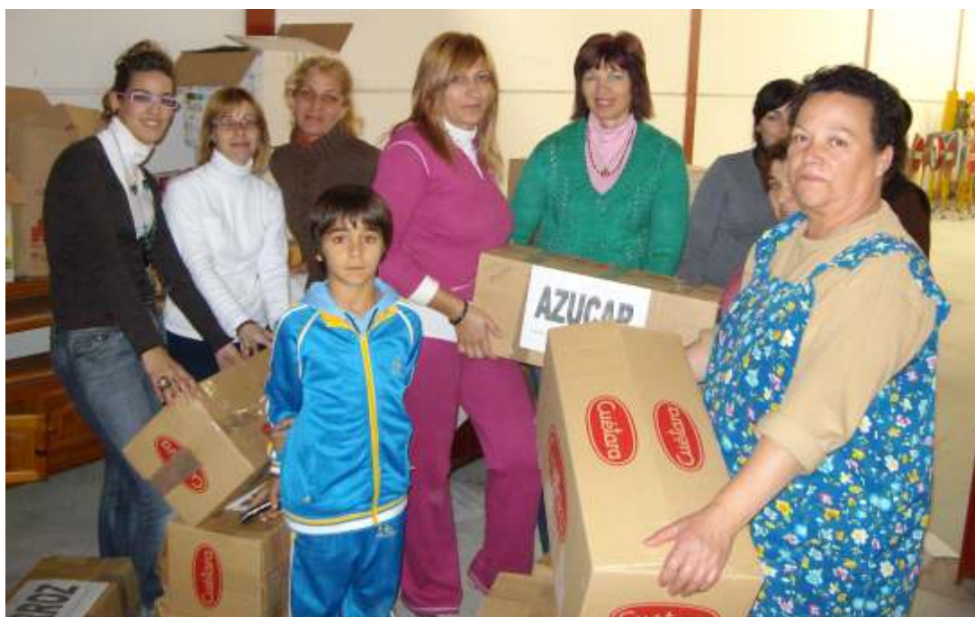
Miembros de la Asociación organizan los alimentos para poder enviarse