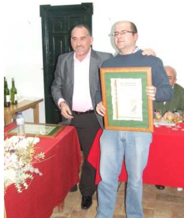
El ganador posa junto al alcalde e nuestro pueblo