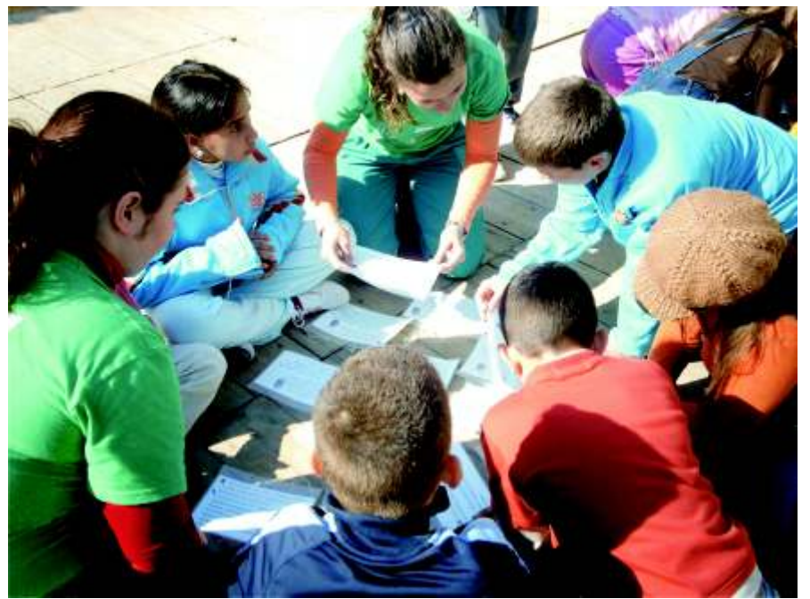
Los alumnos de la escuela taller colaboran activamente en las Jornadas