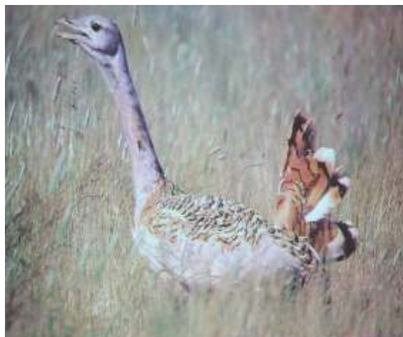
Dos de las imágenes que nos gustaría volver a ver en nuestra querida Laguna Toyón

mil centro informático enium Diseño de Software a Medida Servicio Técnico Propio Cursos de Formación