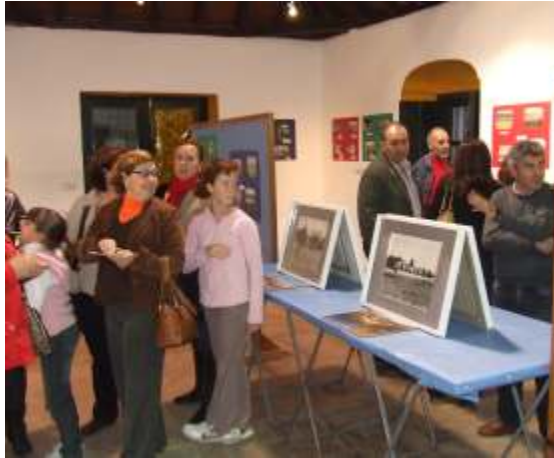
Asistentes a la exposición de fotos

La exposición de fotos relacionadas con la laguna fue muy visitada tanto el día de su inauguración como el día de su clausura y las ponencias que se realizaron el mismo Viernes en la Casa de Postas dejaron muy claro que los ciudadanos cuerveñ@s estamos concienciados