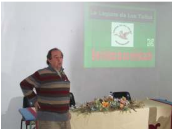
Momento de una de las ponencias con la recuperación de este lugar emblemático para nosotros.

La organización del evento quiso agradecer a I@s alumn@s de la escuela taller su colaboración para la organización de las jornadas y les entregaron un plato conmemorativo, así como a los miembros de ecologistas en acción que participaron en la actividad y que dejaron bien claro que debemos estar encima de la recuperación total de la laguna ya que si bien la Junta de Andalucía ha comprado los terrenos y tiene intención de recuperarla, será muy complicado, entre otros aspectos por la cantidad de plomo que hay en la misma debido a las tiradas al plato que se han hecho en los últimos años ya que el plomo es un material muy perjudicial para las aves por su alta toxicidad por lo que no sólo será llenar las charcas de material sino que habrá que limpiarlas antes.