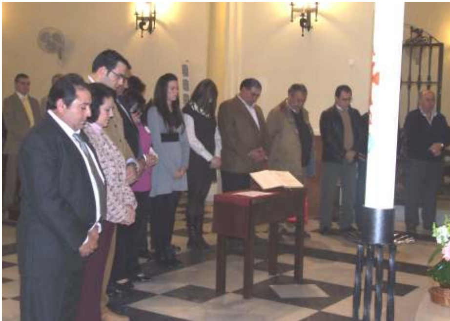
La nueva Junta directiva recibe la Bendición del Párroco

El pasado 19 de Enero tuvo lugar la Misa Rociera para la constitución y juramento de los nuevos componentes de la junta directiva provisional de la nueva Asociación Parroquial Rociera, en un acto muy bonito en el que el Coro Rociero Nuestra Señora de la Laguna puso sus voces para cantar la Misa, se constituyó oficialmente esta Asociación que con gran ilusión comenzó a andar con la peregrinación al Rocío que hicieron el pasado mes de Noviembre y en la que participaron, al igual que en la Misa, un gran número de devotos a la Virgen del Rocío.