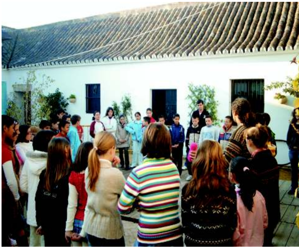
Los escolares fueron uno de los grupos que acudieron a las Jornadas por el reciclaje