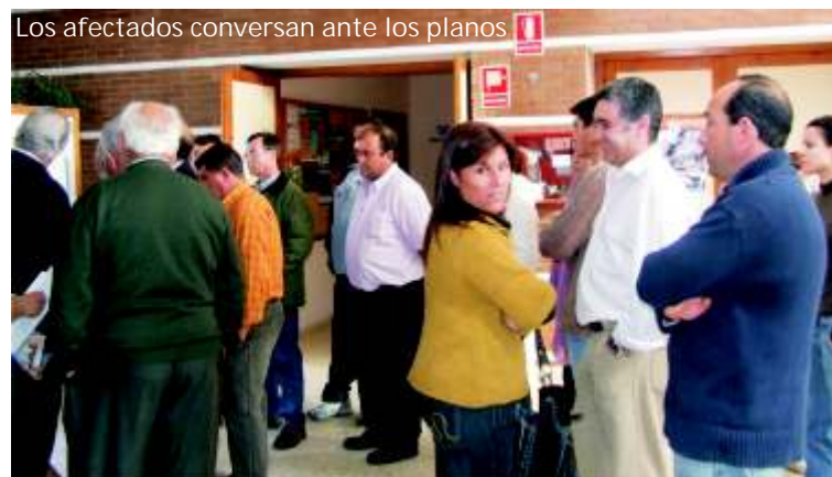
Los afectados conversan ante los planos