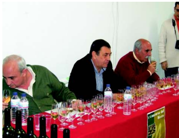
El jurado lo tuvo muy difícil para elegir al ganador

Mención especial para el jurado que unánimemente indicaba que los mostos de nuestro pueblo tenían mucha calidad y prueba de ello la dificultad para elegir a los tres ganadores aunque al final se decantaron por el ganador.