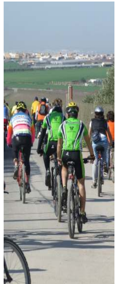
La marcha transcurrió sin incidentes

En el Parque se tomaron un tentempié mientras disfrutaban de un buen día en el que pudieron comprobar la belleza de nuestro Parque así como descansar para a continuación volver a su pueblo tanto grandes como pequeños, que también los había en gran número.